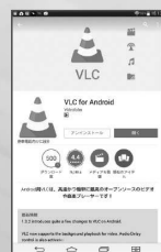
【VLC for Android】インストール画面

※ インターネット・セミナーはパソコンやスマホ・タブレットなどを使い、映像コンテンツを視聴することで、様々なセミナーを受講したり経営情報が取得できるサービスです。 ※ スマホ・タブレットで視聴するためには、専用ソフト(無料)をインストールする必要があります。 ※ スマホ・タブレットは、Androidのみの対応となります。