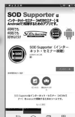
【SOD Supporter】インストール画面