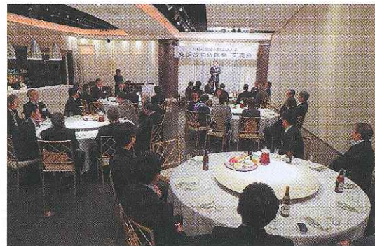
支部合同研修会交流会(11月)