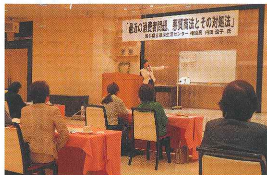
女性部会 消費生活出前講座(12月)