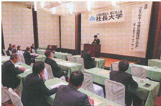
学習院大学学長井上寿一氏講演会(10月)