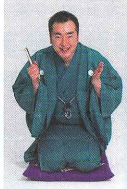
衣川出身 奥州大使