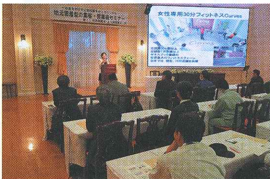
青年部会 集客・営業術セミナー(12月)