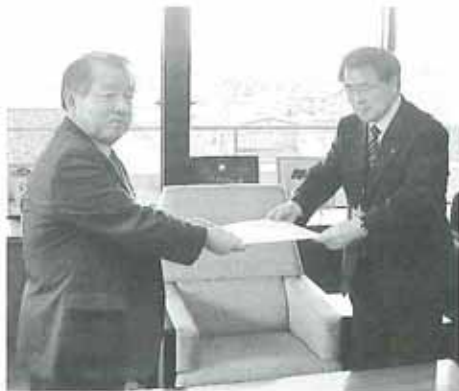
奥州市長 小沢昌記氏(総務部長)

沢一郎議員、小沢昌記奥州市長、渡辺忠奥州市議会議員宛に提言書を手渡し、要望活動を行った。