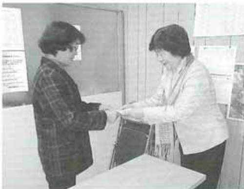
気仙地区女性部会長へ手渡す小平女性部会長

また、青年部会では9月に開催された宮古秋まつり山車引きとして参加し、宮古の復興祭に協力した。