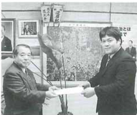
衆議院議員 小沢一郎氏(秘書)

沢一郎議員、小沢昌記奥州市長、渡辺忠奥州市議会議員宛に提言書を手渡し、要望活動を行った。